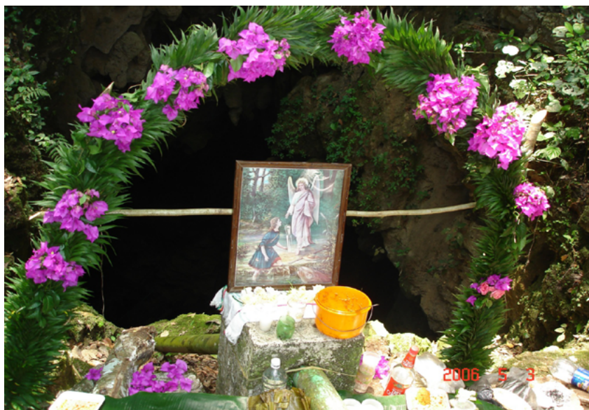
Foto 5. La ofrenda en la entrada de la cueva del Agua.

La ofrenda en el depósito del agua. Para cerrar con la serie de rituales dedicadas a despertar a los seres fríos y el despertar de Dhipaak en las matitas del maíz que se sembrarán, se realiza un ritual en el depósito de agua, donde se distribuye a las comunidades del municipio de Aquismón.