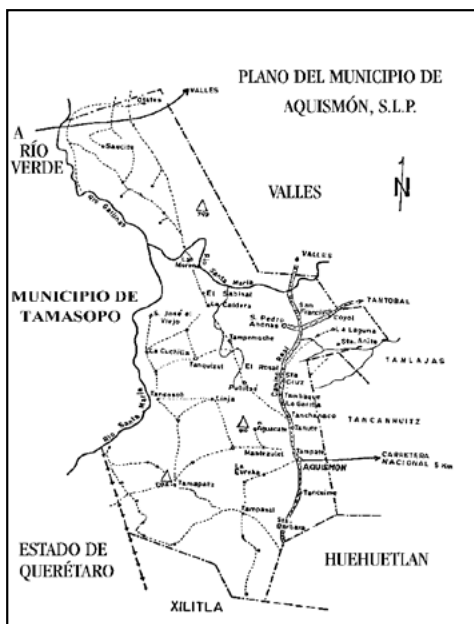
Mapa 1. Plano del municipio de Aquismón.

En el México antiguo, los cerros, las cumbres de algunas montañas, así como las cuevas y ojos de agua, fueron considerados vías de comunicación o de unión entre los diferentes niveles que componían el cosmos entre los habitantes de Mesoamérica. Aún hoy, es posible encontrar esas antiguas creencias entre los descendientes indígenas actuales de nuestro territorio.