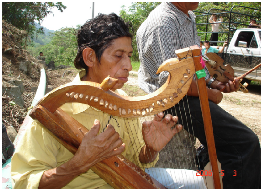
Foto 3. La danza tzacamson en el depósito de agua.