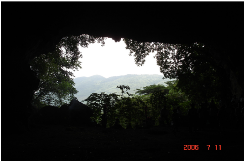
Foto 1. Las cuevas como lugares de adoración a las deidades en los rituales.

Se llevan a efecto rituales propiciatorios (3 de mayo) para atraer la lluvia y que el preciado líquido no falte a lo largo de todo el ciclo agrícola. Dichos rituales se realizan en cerros, cuevas o depósitos de agua. Entre las cuevas están la de Bocomiin, la del agua, la de la Ventana, la de la Fertilidad.