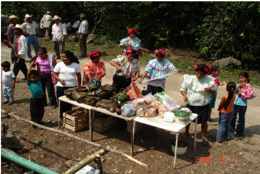
Foto 6. Ofrenda en el depósito de agua, 3 de mayo.

El ritual consiste en la bendición del preciado líquido en los cuatro puntos cardinales del depósito. Se hacen oraciones en teenek, se sahúma a cada punto cardinal con los paquetes de copal que le corresponden y se coloca una gran ofrenda alimenticia, floral y líquida. Se interpretan los sones marcados, según el orden del ritual para cada khidel musical en el altar levantado, y los danzantes bailan al ritmo de la música de la danza tzacamson. Esta danza es propicia para el despertar de Dhipak y los seres fríos en las próximas lluvias del ciclo agrícola. Dichas asociaciones son muy importantes en la cosmovisión teenek.