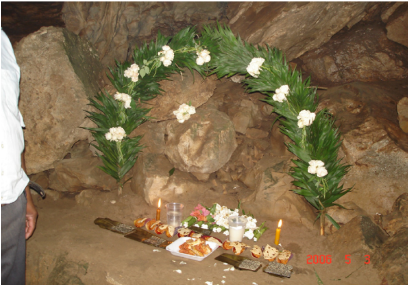
Foto 4. Ofrenda miniatura para las deidades cársticas.

Más abajo, dentro de la cueva, se ha instalado otro altar y arco en miniatura con doce flores blancas y una ofrenda chiquita muy sui generis que, a continuación, detallo: se colocan sobre el piso cuatro hojas de papatla (en teenek, dhulup. Heliconia schiedeana ), las cuales contienen cuatro tamales de bolita de masa, con pedazos de hígado de gallo, que parecen ojos. Cada papatla tiene un número exacto de tamales. Están dedicadas a los puntos cardinales: las doce rosas blancas envueltas que suman doce hojas de naranjo. Tiene relación este número con el oriente, según nuestro informante, así como el número de puños de copal vertidos en el sahumador cuando la oración va dirigida al oriente. En el sur, le corresponde el número 9; al oriente, le corresponde el número 8, y al norte, el número 7. Este número, así como sus múltiplos, es de los muertos.