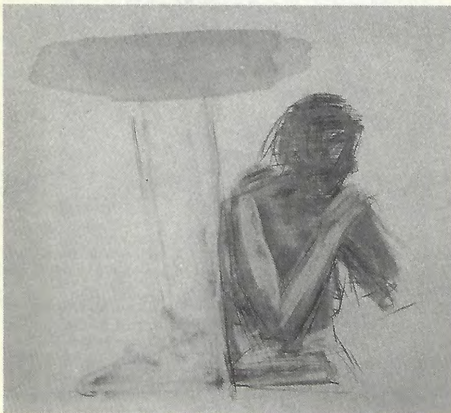
Nube , 1992

Los desnudos y figuras de la pintura de C. Balthazar parecen mostrar que ya no podemos captarnos como una unidad orgánica de la belleza. La belleza en nosotros está en estado de zozobra, es un viaje deseante en la desarticulación, en el desmembramiento. Somos los últimos mujeres y hombres y estamos arrojados y suspendidos en la movilidad de una fragmentación que capta el pin-