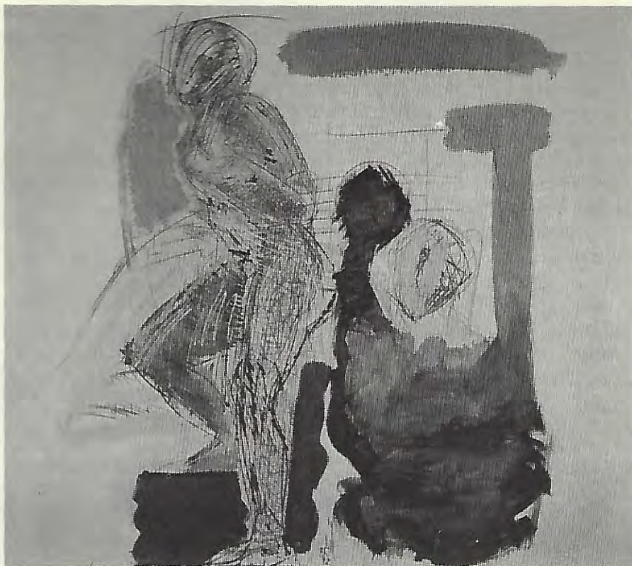
Giro del héroe, 1992

resuenan entre sí componiendo una nueva visión. Es sólo en virtud de los límites de la presente reflexión que el haz orgánico de sus propuestas se divide acomodado a nuestros atisbos, a nuestro intento de escuchar las creaciones de una fragua en su origen más imprevisible, emergentes de la aleación de ceguera-videncia en el que se pintan.