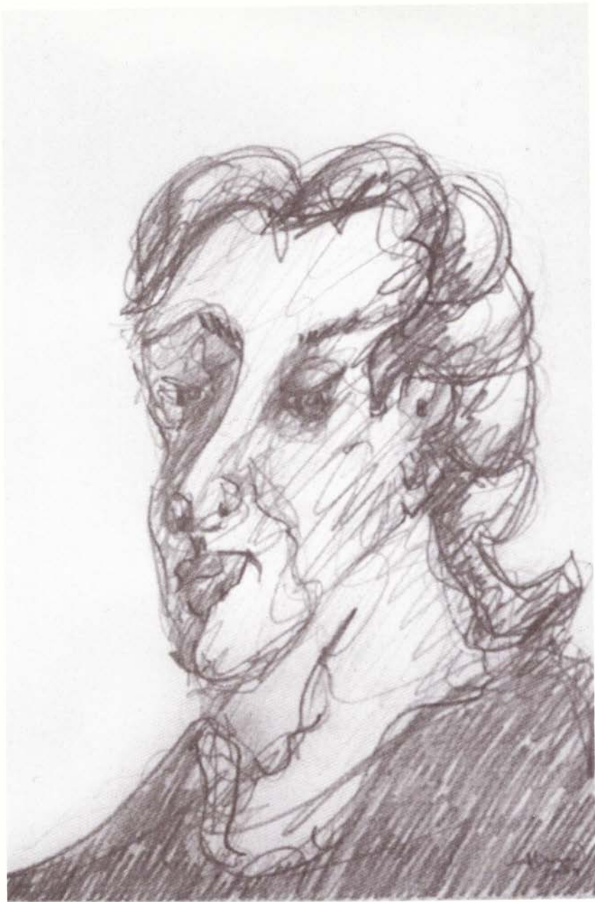
Resignación , serie "Visitas al hospital", lápiz sobre papel, 38.5 x 29 cm, 2004