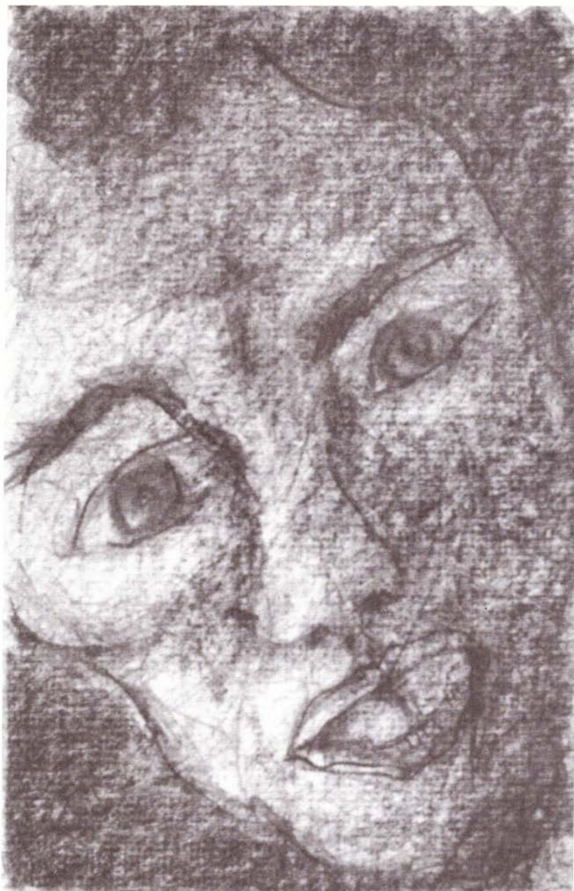
Niño da da , serie "Visitas al hospital", grafito sobre papel, 38.5 x 29 cm, 2004