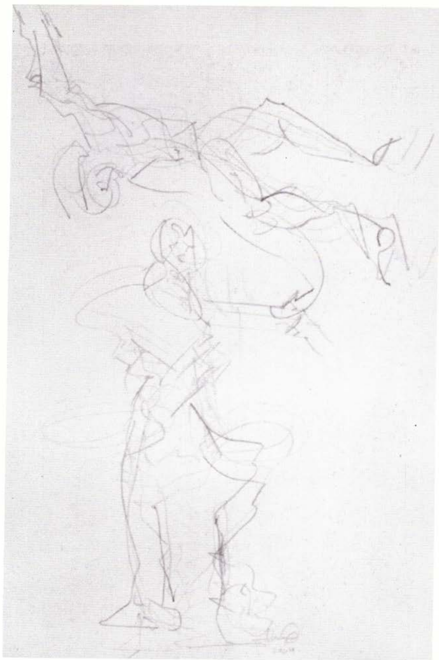
Crisis de ausencia II , serie "Visitas al hospital", lápiz sobre papel, 38.5 x 29 cm, 2004