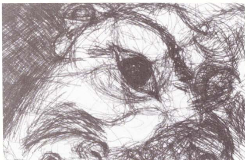
Epilepsa y Familiar, serie "Visitas al hospital", dipúico, boligrato sobre papel 38,5 x 29 cm, 2004