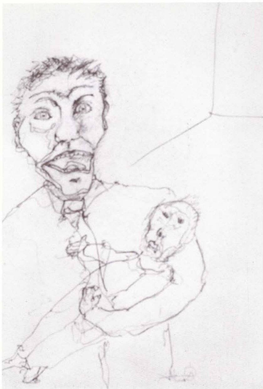
¿?, serie "Visitas al hospital", lápiz sobre papel, 38.5 x 29 cm, 2004