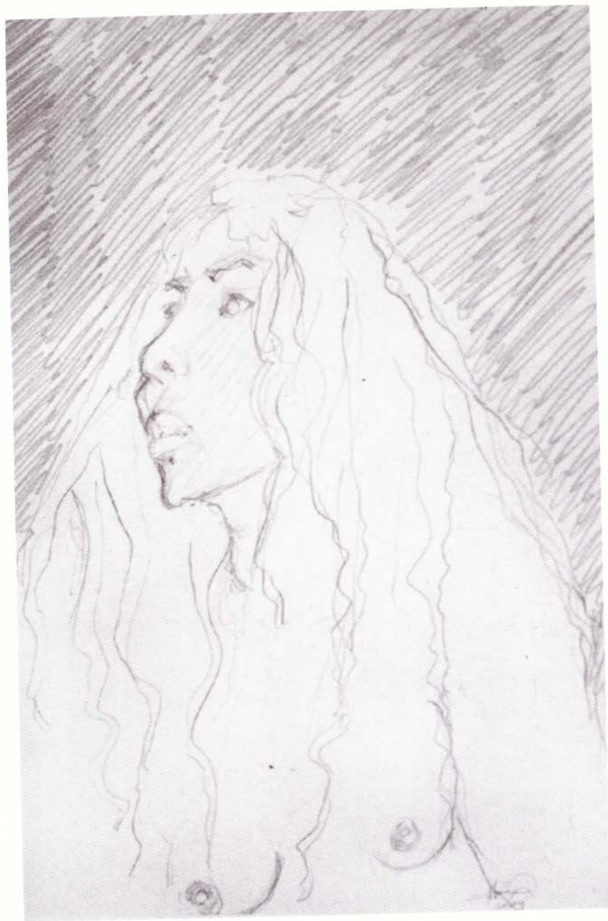
Musa en el solar de la tuberculosis I, serie "Visitas al hospital", lápiz sobre papel, 38.5 x 29 cm, 2004