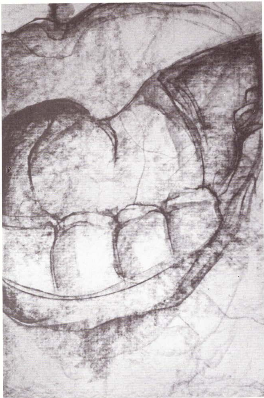
Da da , serie "Visitas al hospital", grafito sobre papel, 38.5 x 29 cm, 2004