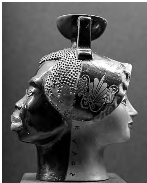
Figura 1. Cabeza de mujer y cabeza de etíope con la inscripción "kalós". Aríbalo janiforme de figuras rojas. C. 520-510 a.C., Grecia.