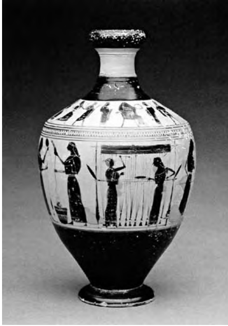
Figura 3. Lecito atribuido al pintor Amasis. Terracota de figuras negras. C. 550-530 a.C. Atenas.