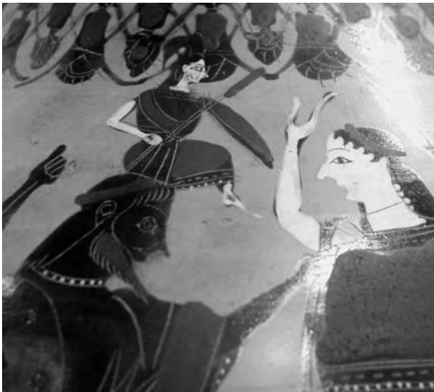
Figura 6. Nacimiento de Atenea armada que emerge de la cabeza de Zeus. Detalle del lado A de ánfora ateniense de figuras negras. C. 550-5250 a.C.