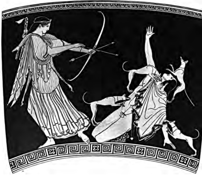
Figura 7. Artemisa, la diosa cazadora, con Acteón

protectora, por lo cual se afirma que, como ella, utilizan de modo privilegiado como arma el arco y llevan un escudo en forma de luna. Para reproducirse, se unían sexualmente a extranjeros y, en el momento del parto, mataban a los hijos varones o, según otras versiones, los cegaban para debilitarlos y someterlos a esclavitud. “Mientras que las ‘auténticas mujeres’ ofrecen a los hombres su tierra-ventre para que la siembren y hagan crecer la planta masculina que los perpetuará después de su muerte, las Amazonas, en cambio —otro sueño masculino—, roban a los hombres su simiente y se sirven de ella para sus propios fines: dar a luz unas hijas que continuarán amenazando el orden masculino desde sus márgenes”. 42 Y más allá de que se considere que los griegos creyeran en la existencia o no de estas mujeres hombrunas, es fundamental observar cómo en estos relatos se estructura un operador imaginario contra todo intento de empoderamiento femenino. Artemisa y Afrodita son el antivarán en un doble sentido: son la negación de la verdadera condición viril y las enemigas a muerte de los varones. Femenidad, salvajismo, barbarie se oponen sin reserva a la masculinidad, la comunidad política y la civilización. La fuerza de esta separación ha delineado con indubitable precisión los avatares de la misoginia occidental.