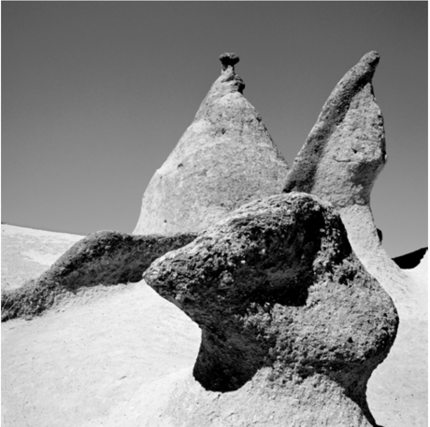
Autor: Isabel Cabrera Título: Capadocia, Turquía Agosto de 2003