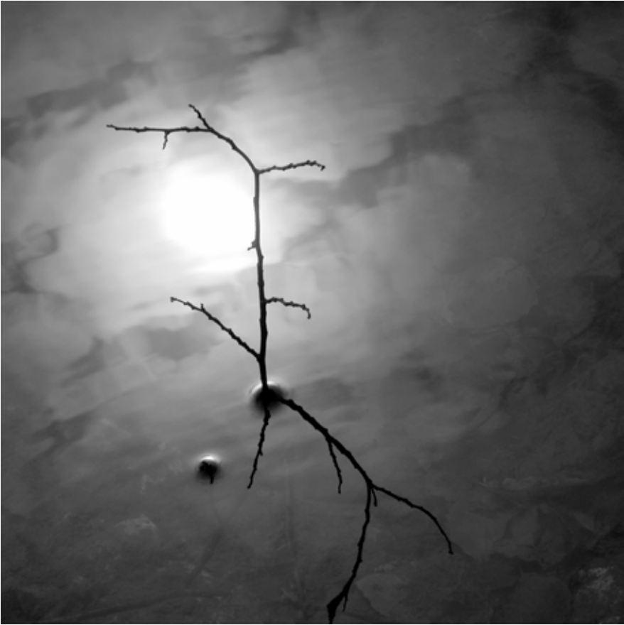
Autor: Isabel Cabrera Título: La Puebla, Comunicación de Madrid Marzo de 2005