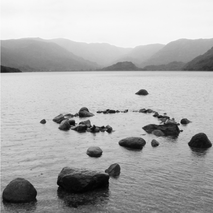
Autor: Isabel Cabrera Título: Lago de Sanabria, España Octubre de 2005