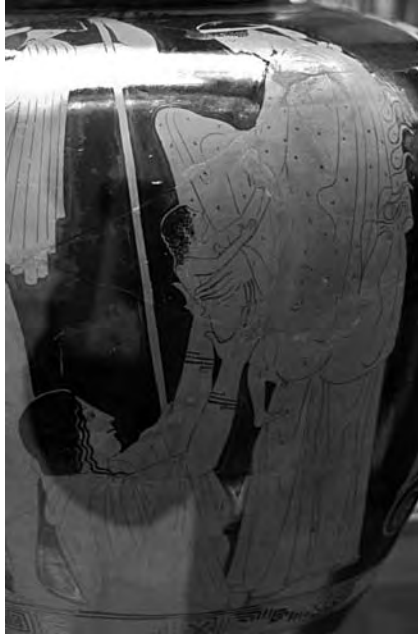
Figura 5. Nacimiento de Erichonion: Atenea recibe al bebé Erichonion de manos de la madre tierra Gaia. Hefestos observa la escena. Lado A de un stamnos de figuras rojas. C. 470-460 a.C. Atenas.