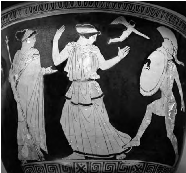
Figura 4. Detalle de crátera: Menelao intenta golpear a Helena; golpeado por su belleza, tira las armas. Un Eros alado y Afrodita observan la escena. C. 450-440 a.C., Egnazia.