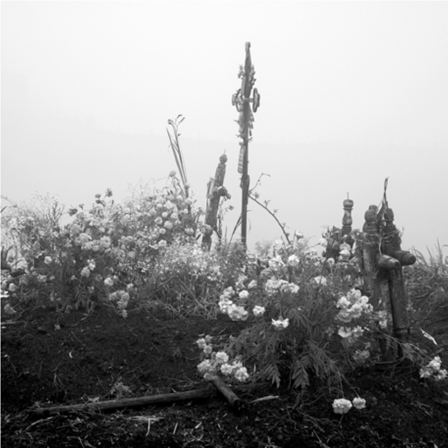
Autor: Isabel Cabrera Título: Cementerio de la Sierra de Puebla Noviembre de 2003