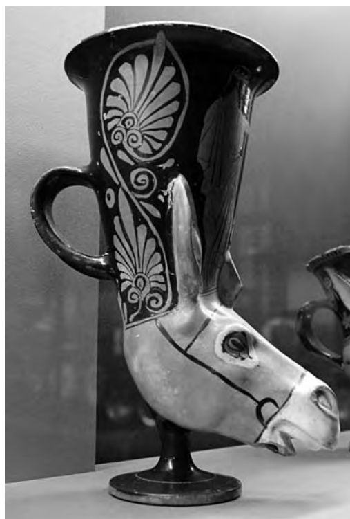
Figura 2. Ritón en forma de cabeza de asno, con representación de Dionisios y una ménade. C. 440-430 a.C., Atenas.